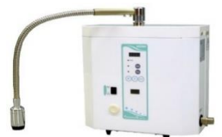
オゾン水(ピュアトロン)