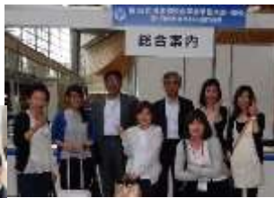
東京国際フォーラムにて