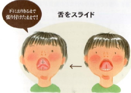
舌を上あごに張り付けたら、口を大きく開けたまま舌全体をうしろにゆっくりとずらしていきます。