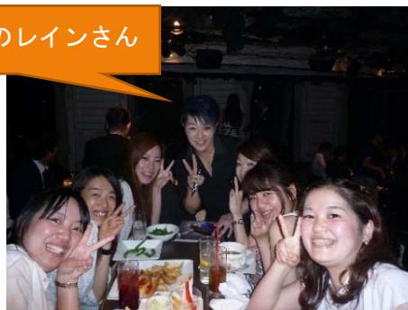
ギャルソンパブ・・・楽しかった～!!