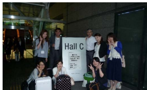
国際フォーラム前にて・・・