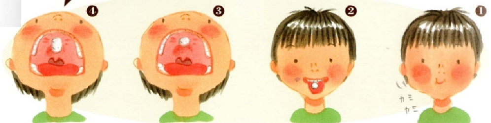
舌をガムにあてたまま、舌をうしろにずらしてガムを引き伸ばします。