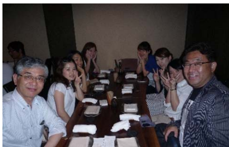
新宿『とりや』で美味しい料理を堪能