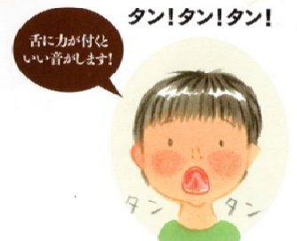
舌を力が付いたいい音がします！ 舌を上あごに張り付け、舌をタン!タン! と鳴らします。